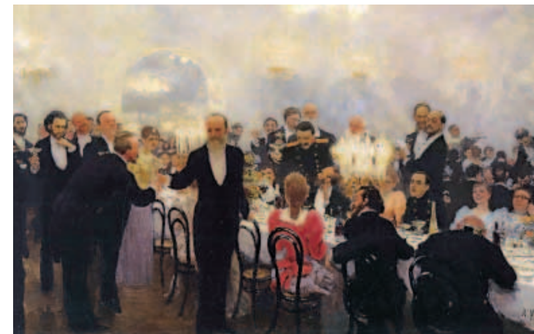
«Юбилейный обед». С картины Ильи Репина. 1893 год.