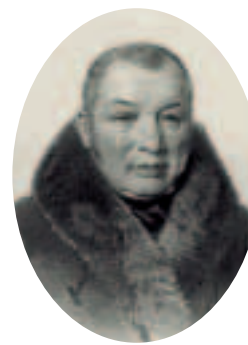
Фаддей Булгарин. Литография Василия Тимма. 1853 год.

ice; they seemed to be made of cast glass in strikingly attractive shapes. A very popular early nineteenth-century dessert went by the name “Vesuvius on Mont Blanc” — white vanilla ice-cream with a blue flame burning on top. Another culinary masterpiece took the form of a temple with columns and a dome made of gold paper. Tea and dessert spoons hung in gold rings around it. Inside, the temple was filled with blocks of different-coloured ice-cream: pistachio, lemon and strawberry, while picturesque ruins made of the same blocks lay outside it.