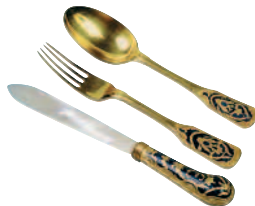
Ниже. Столовый прибор. Из сокровищницы царской семьи Романовых.

Desserts were served with particular sophistication, and they were themselves quite often works of the confectioner’s art. In the mansion on the English Embankment belonging to Countess Zinaida Ivanovna Laval, ice-cream was served in dishes of