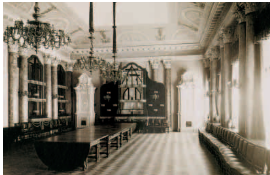
Слева. Большая столовая в Аничковом дворце. 1880—1890-е годы.

Below. The dining-room in the Livadia Palace (Crimea). From a painting by Luigi Premazzi. 1872.