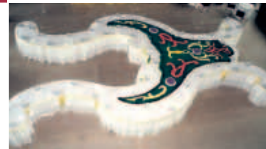
Банкетный стол, воссозданный по эскизам знаменитого архитектора Растрелли в Царском Селе к 300-летию великого зодчего.

In the early eighteenth century tables for a society meal could not be placed in just any way. The arrangement of the tables was supposed either to impress the diners with its elaborate inventiveness or to resemble a familiar symbol — a lyre, crown or double-headed eagle.