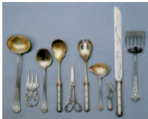
Комплект серебряных столовых приборов, включающий 50 различных предметов, выполненных в стиле неоклассицизма. Продукция фирмы К. Э. и В. А. Болинов. Москва. 1908—1917 годы.