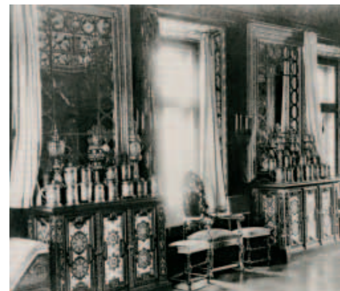
Интерьер Большой столовой палаты во дворце Зинаиды и Феликса Юсуповых. Москва. Фотография 1892—1893 годов.

In the second half of the eighteenth century, simple Russian victuals gave way to elaborate, "many-layered" European foods, particularly French ones. The sumptuous