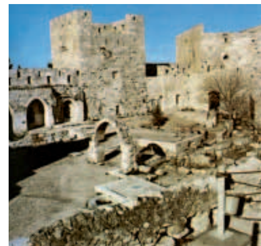
Руины дворца царя Ирода в Иерусалиме. Современная фотография. The ruins of King Herod’s palace in Jerusalem. Present-day photograph.

After the war Joseph was given Roman citizenship — the highest honour for a mem-