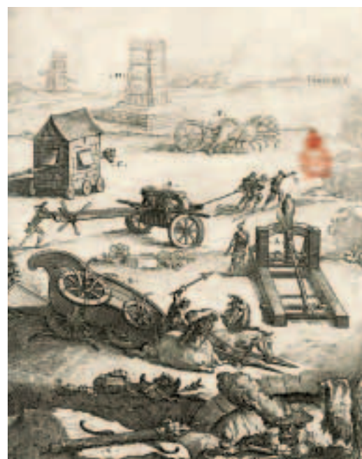
Справа. В 69 году Веспасиан взшел на престол и стал основателем новой династии римских императоров — династии Флавиев. Гравюра неизвестного художника.

Пятнадцать лет спустя появилась новая книга Иосифа Флавия — «Иудейские древности». На сей раз историк попытался изложить на изысканном греческом языке хроники своего народа — от сотворения Адама до воцарения Нерона. С одинаковым интересом описывает он эпохальные события и дворцовые интриги. Упомянется в «Иудейских древностях», между прочим, и о распятии Иисуса, но этот фрагмент явно выделяется из остального текста — он написан так, будто принадлежит перу средневекового христианина.