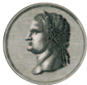
Right. In AD 69 Vespasian came to the throne as the first of a new dynasty of Roman emperors — the Flavians. Engraving by an unknown artist.