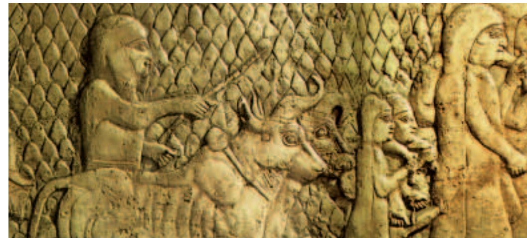
The resettlement of Jewish women and children in Babylon. Fragment of a 7th-century BC relief found at Nineveh.

Иосиф Флавий родился в Иерусалиме в аристократической священнической семье. Ему исполнилось двадцать шесть, когда он был послан в Рим с поручением добиться освобождения нескольких еврейских жрецов. Рим произвел на него очень сильное впечатление.