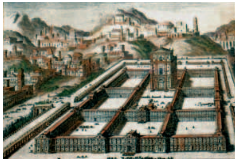
Слева и внизу. Знаменитый храм Соломона был разрушен после завоевания Иерусалима вавилонянами. Макет Второго храма, возведенного на месте прежнего, можно увидеть сегодня в саду иерусалимского отеля «Холилэнд». Макет был создан на основе письменных источников и археологических находок. В 70 году Второй храм был разрушен римлянами. Уцелела лишь его западная стена, которая ныне одна из главных еврейских святынь — Стена Плача.

Иудеи с удивлением увидели, что от их независимости ничего не осталось. Но они еще не извели римского меча и потому были уверены в себе. Страна бурлила.