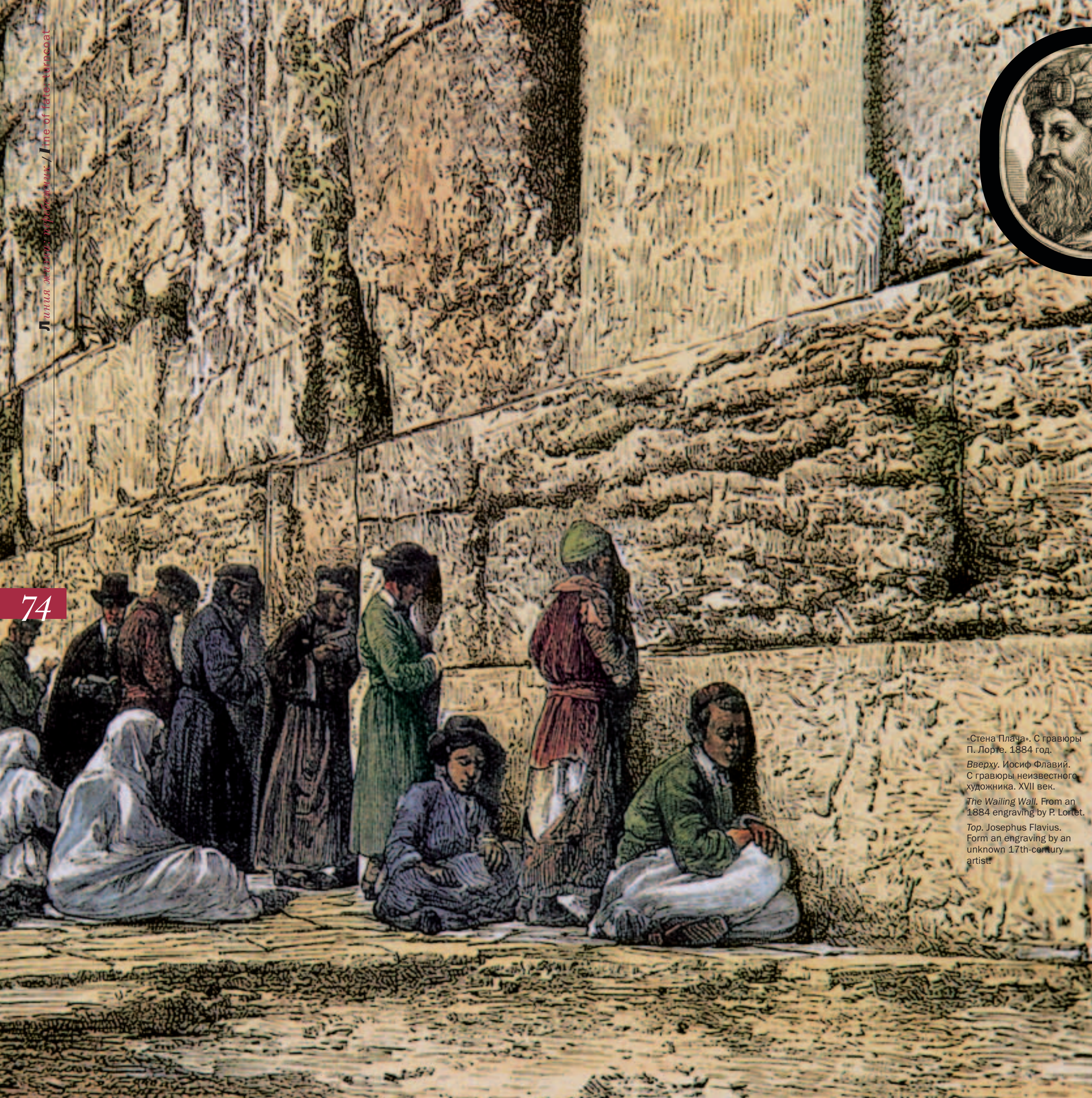
«Стена Плача». С гравюры П. Лорте, 1884 год. Вверху. Иосиф Флавий. С гравюры неизвестного художника. XVII век. The Wailing Wall. From an 1884 engraving by P. Lortet. Top. Josephus Flavius. Form an engraving by an unknown 17th-century artist.