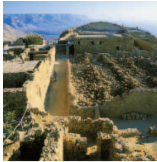
Крепость Масада. Современные фотографии.

Масада — мощная крепость, расположенная в 90 километрах от Иерусалима. Она выстается на вершине стометровой скалы с плоской вершиной.