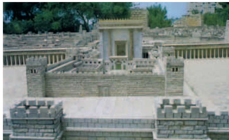
Left and above. The famous Temple of Solomon was destroyed after the Babylonians conquered Jerusalem. A model of the second temple that was constructed on the site of the first can be seen today in the garden of the Holy Land Hotel in Jerusalem. It was made on the basis of written sources and archaeological finds. In AD 70 the second temple was destroyed by the Romans. Only its western wall survived and it is now one of Judaism's most holy places — the Wailing Wall.

бескровно: великий полководец, освободитель страны Иуда Маккавей заключил в 160 году до н. э. оборонительный союз с Римом против сирийцев, потом, полтора столетия спустя, Ирод Великий признал вассальную зависимость от Рима... И наконец, после смерти Ирода стра-