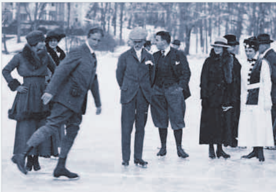
Bottom right. Fiodor Chaliapin on the ice at Ilya Repin's estate of Penaty in Kuokkala (now Repino). 1914 photograph by Karl Bulla.