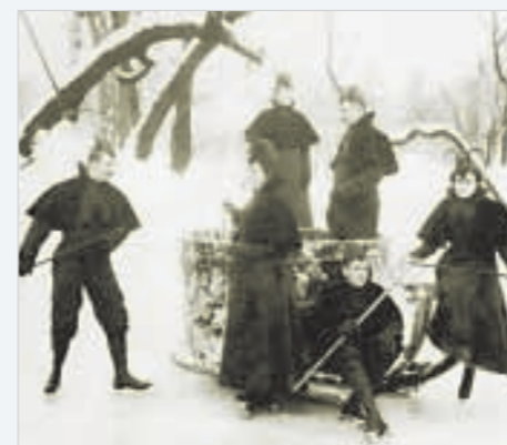
Маскарад на катке Юсуповского сада ежегодно проходил на масленичной неделе. 1900 год.

Intermittent thaws and water from the drains affected the quality of the ice and there were instances of skaters falling through. The city's press sounded the alarm. The Peterburgsky Listok claimed that there was only one truly safe rink in the capital – on Obvodny Canal, because it was