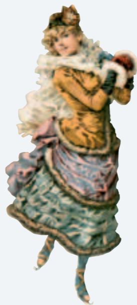
Иллюстрация из журнала мод конца XIX века. An illustration from a late nineteenth-century fashion magazine.

A rink was created in Kronstadt for the sailors. A correspondent for one local newspaper wrote on 11 December 1868 how impressed he had been by the sight of it — smooth and slippery “as the slipperiest ballroom parquet. On the ice dozens of gentlemen, boys and girls are skating or pushing chairs on runners, performing figures and dancing quadrilles. Next to the ramp a nice little house has been built with a flag on top and an open gallery where the devotees of these healthy winter pastimes go to warm themselves. The rink, slides and house all belong to the “Society of Lovers of Slippery Pleasures”, whose members pay 5 roubles per winter for all this. At present the society has 120 members.” Another Kronstadt reporter observed that “in the present season the rink on the Italian Pond is distinguishing itself with great refinement and facilities for visitors. On a barge placed by the bank two little rooms have been organized where one can get warm; here too is something like a veranda from which one can admire the graceful pretty female skaters.”