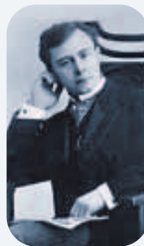
Right. The Polish-American pianist Józef Hofmann, a pupil of Anton Rubinstein.

Справа внизу. Федор Шаляпин на катке в усадьбе «Пенаты». Куоккала. 1914 год.