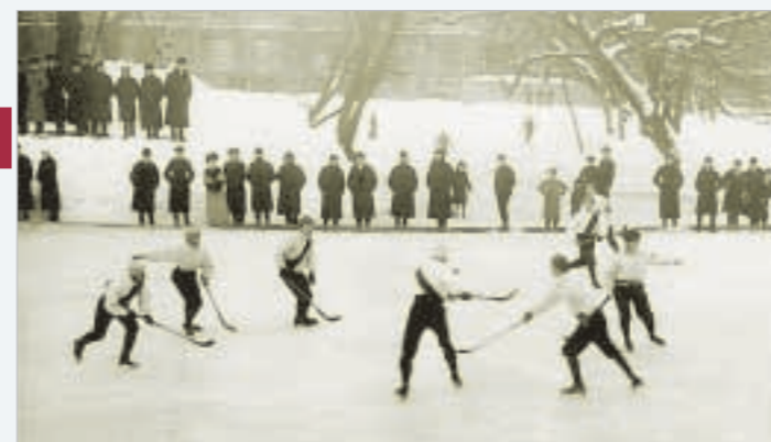
Состязания по хоккею в Юсуповском саду. Петербург. 1914 год. Ice-hockey matches in the Yusupov Garden, St Petersburg. 1914.

made in the bottom of big barges. This method was soon being used elsewhere, especially as barges were sold off very cheaply at the end of the navigation season.