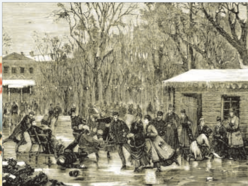
«Каток в Юсуповском саду». Гравюра на дереве неизвестного художника. 1881 год. The Skating-Rink in the Yusupov Garden. Wood engraving by an unknown artist. 1881.

bearing the names of would-be members were hung on the walls of our hut on the ice. Each was divided into two columns, one headed Yes, the other No. The majority of signatures for or against determined the approval or rejection of a particular candidate as a member of our Skaters' Club.”