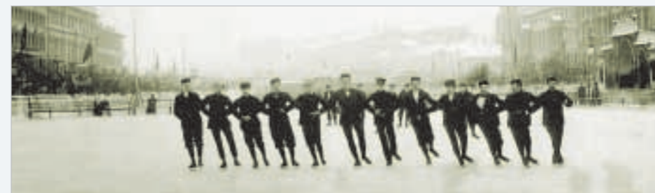
Figure skaters on the Semionovskii rink in St Petersburg. 1900