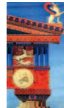
Слева. Пропилеи. Реконструкция архитектора Луи Франсуа Филиппа Буатта. Конец XIX—начало XX века.

Но, что доставило жителям всего больше удовольствия и послужило городу украшением, что приводило весь свет в изумление, что, наконец, является единственным доказательством того, что просла-