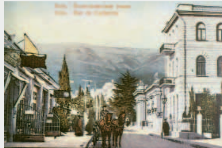
Выше. Ялта. Елизаветинская улица. С открытки начала XX века. Above. Elizabeth Street in Yalta. From an early-20th-century postcard.