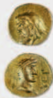
Античные золотые монеты, найденные в Крыму. С изображением головы сатира (выше) — город Пантикапей, IV век до н. э. С изображением головы божества Херсонеса — город Херсонес, 47 год н. э.

But the hospitality of the Soviet side did not in the least signify a willingness to make concessions in the diplomatic negotiations. Despite Roosevelt and Churchill having already agreed tactics for talking with Stalin, the Generalissimo stuck to a fairly hard line