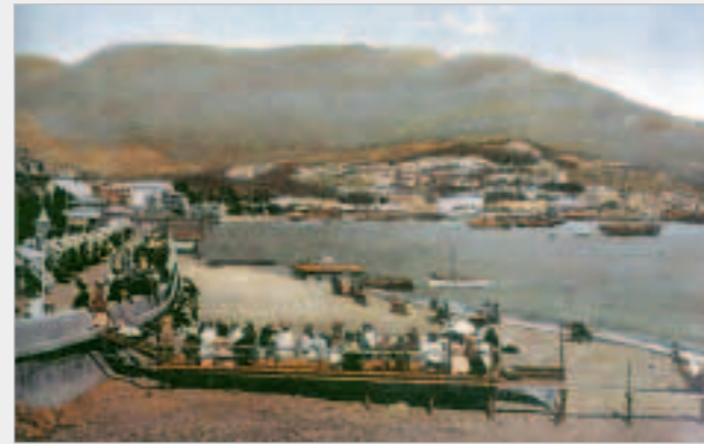
Справа. Ялта. пляж у Александровского сквера. С открытки начала XX века.