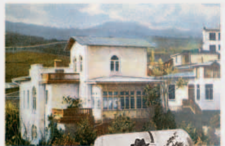
Выше. «Белая дача», ставшая музеем Антона Чехова, была открыта для посещения в первый же год после кончины писателя.

The collapse of the Russian Empire echoed in Yalta as well: a struggle for power