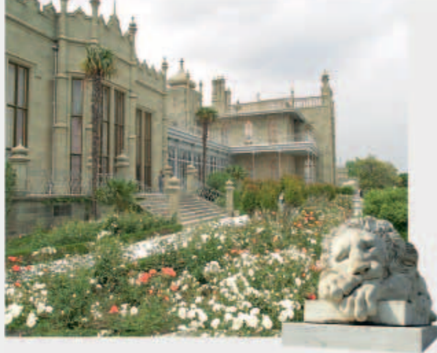
Выше. Воронцовский дворец в Алушке. Справа. Спящий лев — украшение дворца.

Дворец графа Воронцова в Алушке, где разместились британцы, построенный по проекту английского архитектора в стиле поздней английской готики, особенно понравился Черчиллю, обнаружившему в «далекой России» кусочек своей родины.