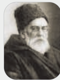
Основоположник русского виноделия в Крыму Лев Голицын. По его проектам были построены крупнейшие крымские винохранилища. Lev Golitsyn, the founding-father of Russian wine-making in the Crimea. The largest Crimean wine-stores were built to his designs.

В первые послевоенные годы город удалось восстановить, а потом он начал развиваться быстрыми темпами. В 1960-х годах было построено новое Южнобережное шоссе, связавшее Ялту с Севастополем, Алуштой и Симферополем. Город преобразился и расцвел: появились новые санатории и дома отдыха, гостиницы и жилые здания. Продолжала работать и Ялтинская киностудия; винодельческий комбинат «Массандра» выпускал известные всей России вина... Ялта стала самым фешенебельным курортным местом в Крыму и по сей день им остается. ■