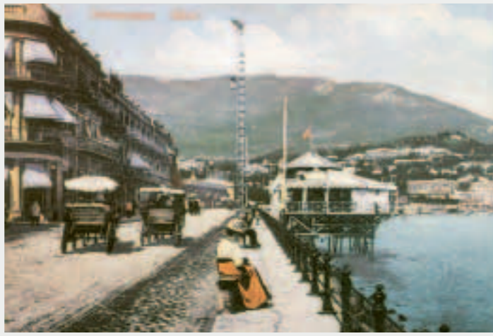
Ялта. Набережная. С открытки начала XX века. Набережная имени Ленина — главная прогулочная улица города.