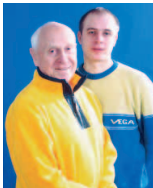
Два Михаила — дед и внук. Two Mikhails — grandfather and grandson.