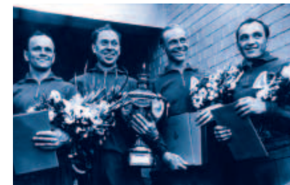
Слева. Ленинградская команда — чемпионы Спартакиады по современному пятиборью 1959 года.