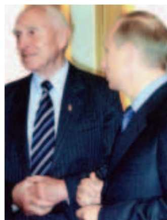
Президент Федерации современного пятиборья Санкт-Петербурга и Ленинградской области Михаил Бобров и Президент Российской Федерации Владимир Путин.