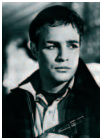
Марлон Брандо не подозревал, что нравственные мучения его героя из картины «В порту» были так близки самому Элии Казану. Marlon Brando did not suspect that the moral torments of his character in On the Waterfront were so familiar to Elia Kazan himself.

Но в памяти значительной части американского киносообщества на великом режиссере Элии Казане так и осталась черная метка. ■