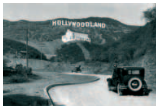
Именами голливудских «красных» КРААД снабжал воинствующий Альянс деятелей киноиндустрии за сохранение американских идеалов.