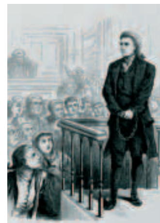
На процессах салеминых ведьм в 1692 году судьи вынесли лишь один оправдательный приговор. 25 человек, отрицавших свою вину, были казнены, но те, кто признался в поклонении сатане и назвал своих «сообщников», были помилованы.