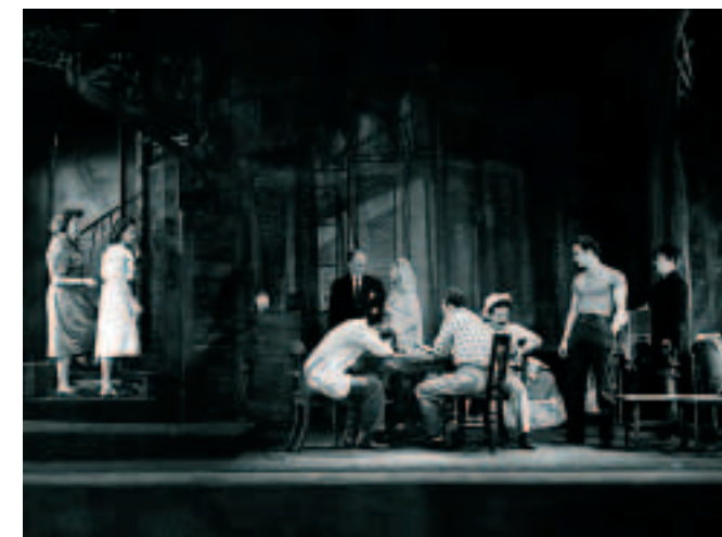
Постановка пьес «Смерть коммивояжера» Артура Миллера и «Трамвай желание» Теннесси Уильямса в конце 40-х годов принесли Казану славу «золотого мальчика Бродвея».

До чего же унижительной оказалась процедура! Никсон задавал все те же вопросы, но теперь за действием, возвышаясь на трибуне, наблюдали члены КРААД. Их интересовало не мнение Гэджа о коммунистах, а лишь имена. Кто завербовал Казана в компартию? Клиффорд Одетс? Джон Гарфильд? Несговорчивость Казана явно выводила конгрессменов из себя. А на следующий день газеты пестрели