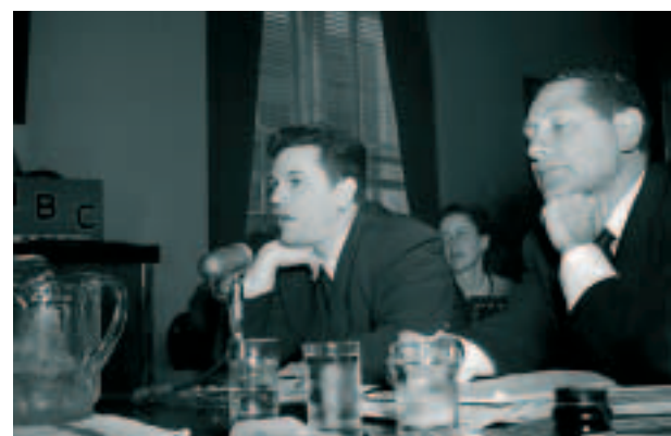
У микрофона Джон Гарфильд. Дважды награжденный «Оскаром» актер не вынес травли, которая началась после его отказа предать товарищей по партиячке в «Груп-театр».