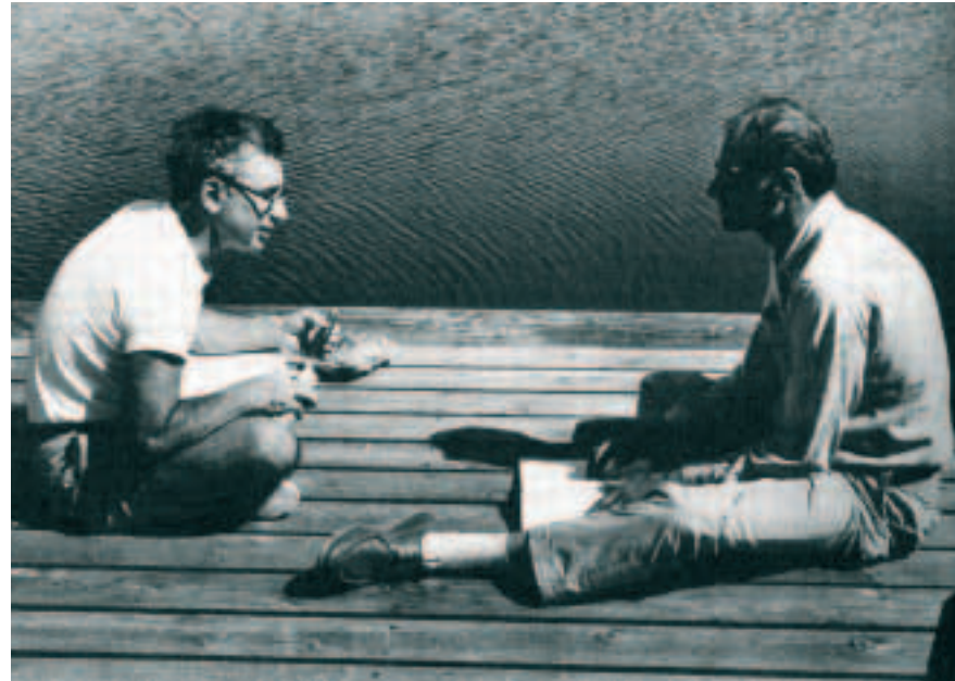
Элиа Казан и Артура Миллера было, как говорится, не разлить водой. Великая дружба рухнула после встречи со строгими джентльменами в Комиссии по расследованию антиамериканской деятельности.

Спустя несколько лет Элиа блистал в постановках «пролетарских» пьес своего друга — драматурга Клиффорда Одетса. Вместе