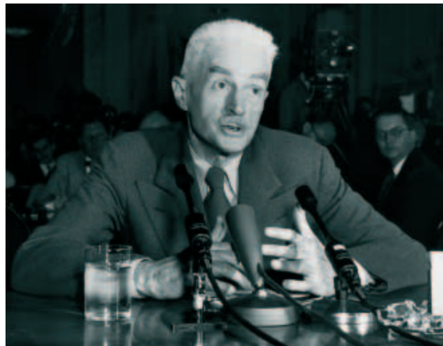
Вверху. Классик американского детектива Дэшил Хэммит провел в тюрьме полгода за отказ указать местонахождение взятых им на поруки и сбжавших коммунистов.

Скурас настойчиво посоветовал Казану сотрудничать с Комиссией Конгресса и даже предложил лично познакомить его со