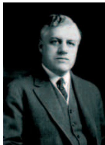
В бытность Александра Палмера министром юстиции в США еще в 1919 году по подозрению в подрывной деятельности были арестованы 10 тысяч человек, из которых 248 депортированы в Россию.