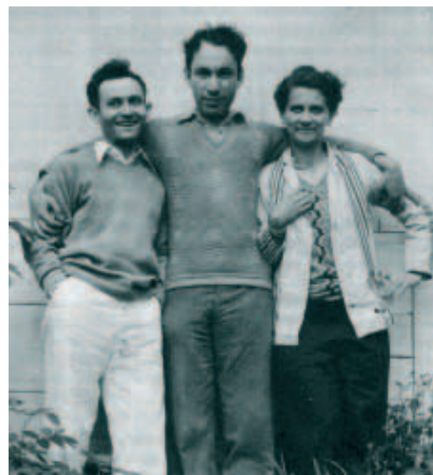
The founders of the Group Theater — Harold Clurman, Lee Strasberg and Cheryl Crawford — were at first unimpressed with the acting talents of the Yale School of Drama student Elia Kazan.