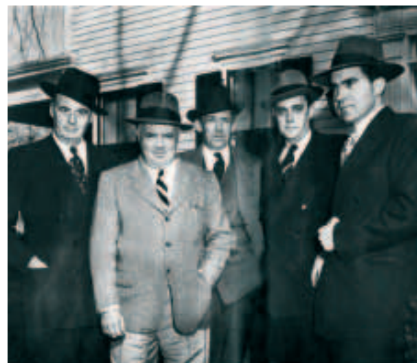
Elia Kazan and Arthur Miller were "thick as thieves." Their great friendship collapsed after a meeting with the strict gentlemen from the House Un-American Activities Committee.