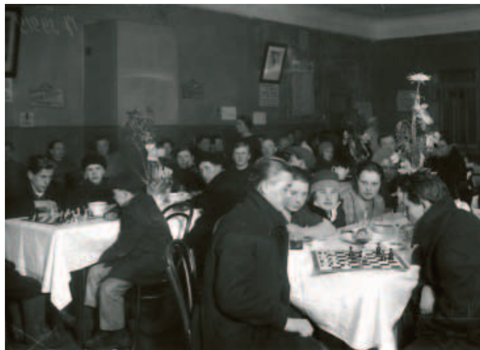
Пропагандистская фотография чайной «Выборгский рабочий», 1928 год.

The authorities did not overlook either various institutions such as the Noble Assembly, the Russian Merchants' Assembly, the Literary and Artistic Society and the Economic Club. Some of them were over a cen-