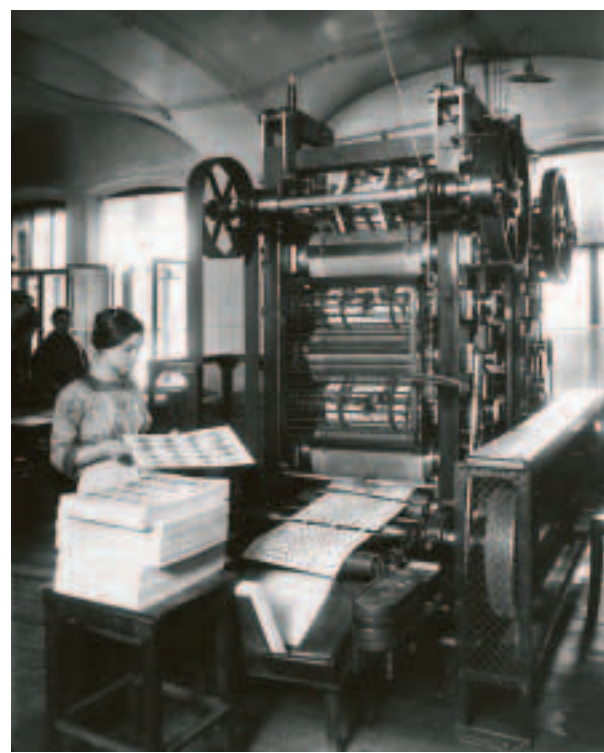
The playing-card factory attached to the Imperial Foundling Hospital. 1913.

С 1817 года в России монопольное право на производство игральных карт имела единственная фабрика, находившаяся в Петербурге.