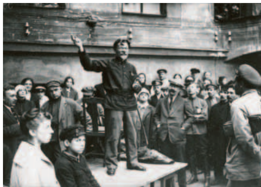
Комиссар городского хозяйства Михаил Калинин считал, что искоренить присущее природе человека влечение к азартным играм невозможно. The Commissar for the Petrograd Municipal Economy, Mikhail Kalinin, believed that it was impossible to eradicate the natural human obsession with gambling.