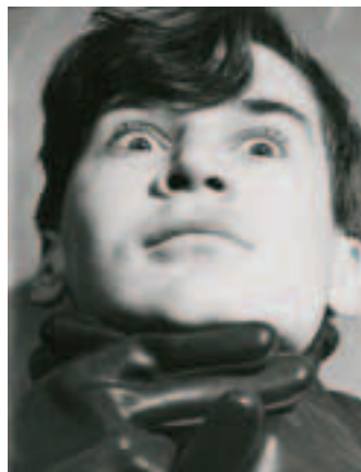
Больше тридцати пяти лет разделяют эти роли. Вверху: Сань (спектакль «Три шпаги на троих» в постановке Театра юношеского творчества); ниже: профессор Хиггинс («Пигмалион»).

— Things are quite awkward with my son regarding New Year presents. When he was little, I exploited his wishes in a really shameless