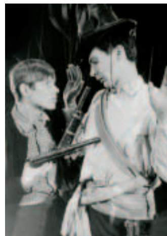
В роли Бура (справа) в спектакле «Тили-тили-тесто». ТЮТ, 1967 год. The part of Boer in the Young People's Creative Theatre production of Tili-Tili-Testo , 1967.

There are more than 35 years between these roles. Above: San (in Three Swords for Three Men staged by the Young People's Creative Theatre); below: Professor Higgins (in Pygmalion ).