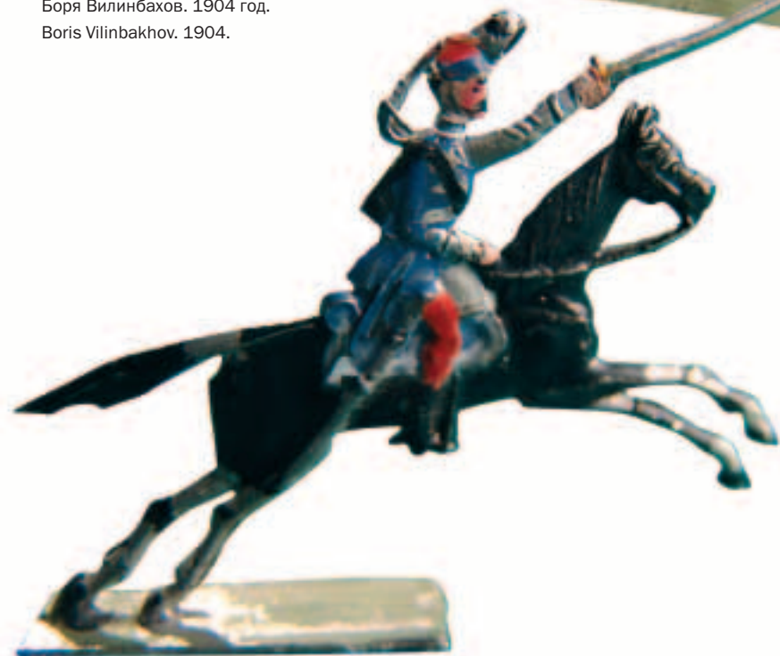
Австрийский гусар второй половины XIX века. Austrian hussar of the second half of the 19th century.

Родина оловянного солдатика – Германия. Ремесленники города Нюрнберга первыми узаконили массовое изготовление этих игрушек на заседании городского совета в 1578 году.