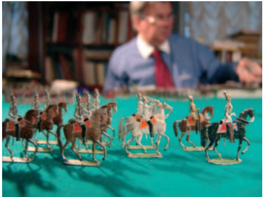
Прусские гвардейские кирасиры второй половины XIX века. Prussian Guards Cuirassiers of the second half of the 19th century.

A philosopher once said that the most peaceful people are those who played at war enough in their childhood.