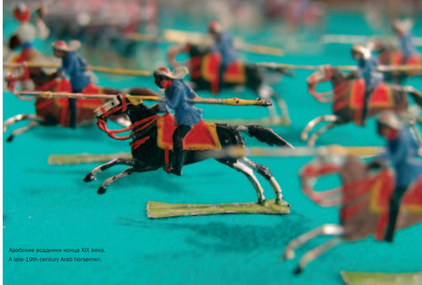
Арабские всадники конца XIX века. A late-19th-century Arab horsemen.

— Нюрнбергские солдатики ведь и изготавливались необыкновенно тщательно?