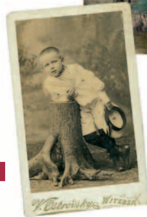
Боря Вилинбахов. 1904 год. Boris Viliinbakhov. 1904.