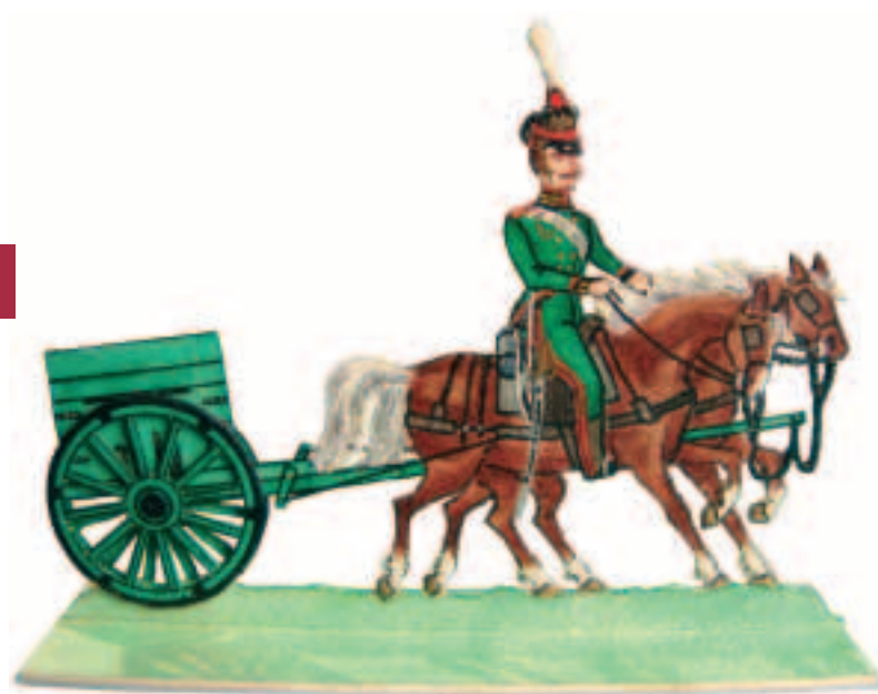
Вверху. Русская гвардейская артиллерия, 1812 год. Справа. Улан Чугуевского полка, 1812 год. Картон, акварель. Работа А. К. Вёдрова. Above. Russian Guards Artillery of 1812. Right. An Uhlan of the Chuguyev Regiment of 1812. Watercolour on cardboard. Made by Andrei Vodrov.

In Russia model soldiers were usually sold in grocery shops, in woven straw boxes.