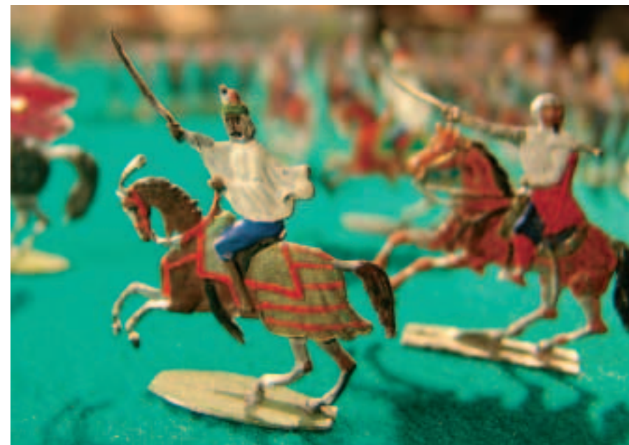
Арабские всадники конца XIX века. A late-19th-century Arab horsemen.

— Nuremberg soldiers were made with unusual care, weren't they?