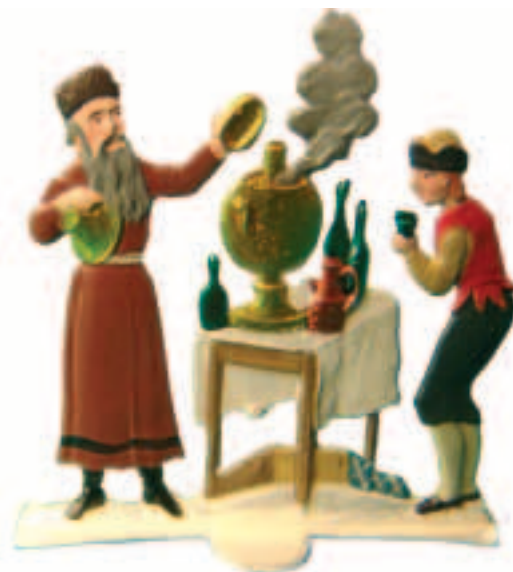
Shrovetide in St Petersburg. Figures made by the firm of Heinrichsen, Nuremberg. 1839.

Французский пехотинец середины XIX века. Mid-19th century French infantryman.