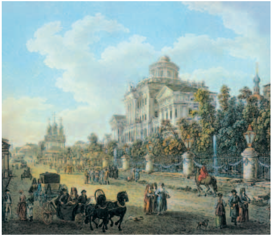
«Пашков дом в Москве». Гравюра с оригинала Ж. Де-лабарта. Конец XVIII века.

Над многими проделками Каина можно от души посмеяться — так оригинальны, озорны они были. Но случались и