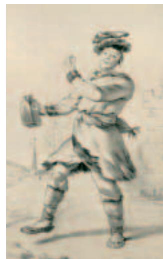
«Гуляка со штофом вина». Литография Барбье. 1824 год. Испокон веков повелось, что «веселие на Руси есть питье». По расчетам 1740 года, на каждого москвича (включая женщин и детей) потреблялось до 32 литров алкоголя в год.

Reveller with a Carafe of Wine. Lithograph by Barbier. 1824.