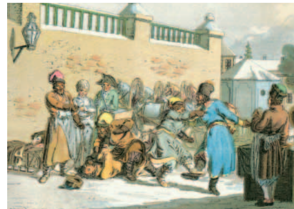
«Уличная сцена во второй половине XVIII века». Раскрашенный офорт Х.-Г. Гейслера. 1790-е годы. Городские власти сквозь пальцы визирали на запрещенные кулачные бои.