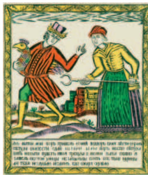
“O my goodness, a thief has got into my yard...” A Russian popular print (lubok). Tinted copperplate engraving. 18th century.

Искусный и изобретательный грабитель, Ванька любил «работать» так красиво, что об отваге и удалстве вора в народе складывали легенды и песни.