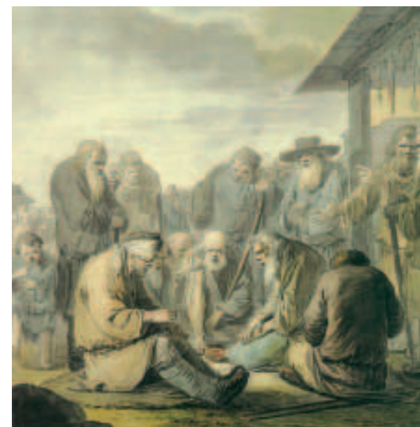
Blind Singers. Watercolour by Ivan Yermenev. Early 1770s. "And blind men sing Lazarus Collecting copper coins In tribute from compassionate onlookers." (Ivan Nikitin)