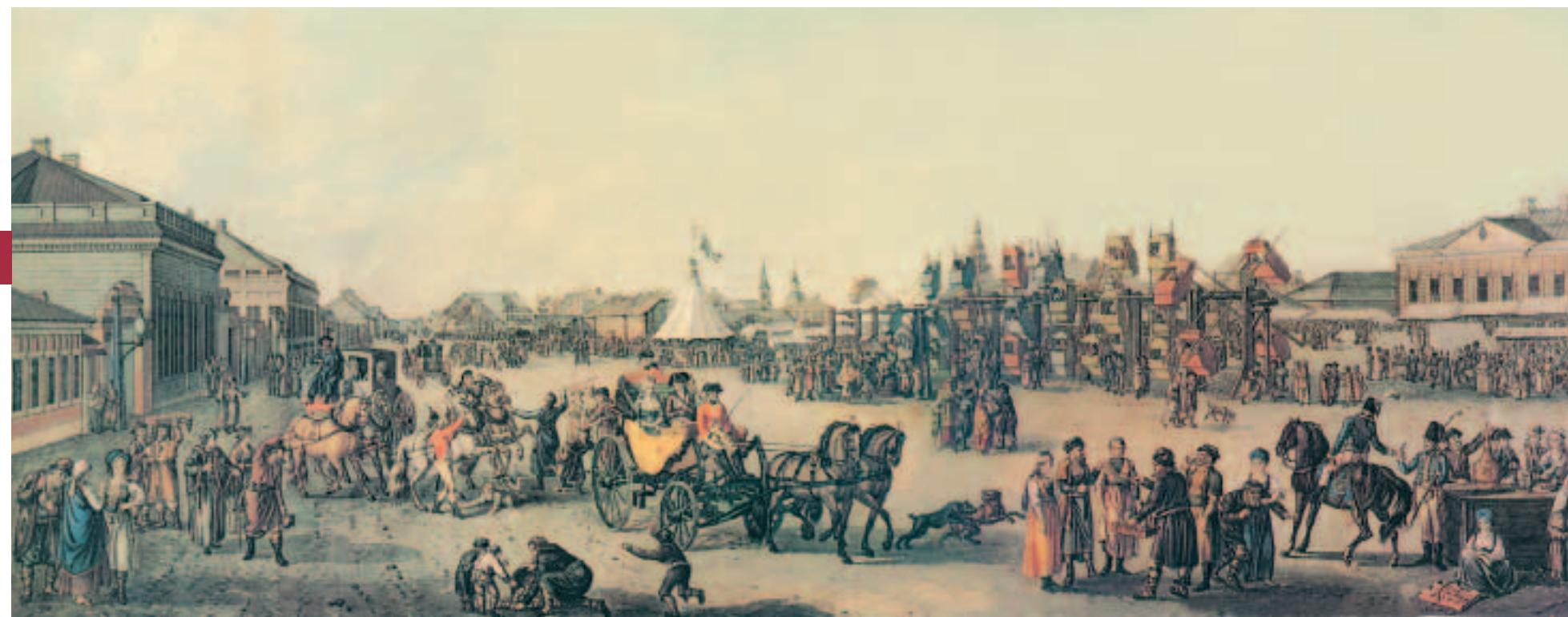
«Подновинское гулянье». Гравюра с оригинала Ж. Делабарта. 1790-е годы.

Vanka chose a smart team. He and his mates never stayed around long anywhere. They stole and robbed, then quickly moved to a new place where they were not known. The best spot of all for criminals was the Nizhny Novgorod fair: lots of people, a crowded crush, drunken merchants — what more could a thief or robber desire? And suddenly the hardened criminal decided to follow the path of virtue and to betray hundreds of his former comrades to boot. What prompted him to do it? Whatever it was, he did indeed make a confession and offer to collaborate with the authorities. The first report, dated 28 December 1741, about the beginning of the round-up of Cain’s confederates has survived. As the scribe recorded, “He, Cain, pointed out a cave near the Moskva River gate and said that the villain and runaway drayman Alexei Solovyev was in that cave, and in that cave the said Solovyev was taken. From his pocket they