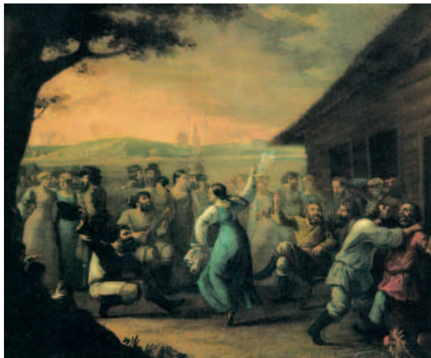
«Сельский праздник». И. Тонков. 1790-е годы. Веселиться и гулять всегда умели и любили на Руси...