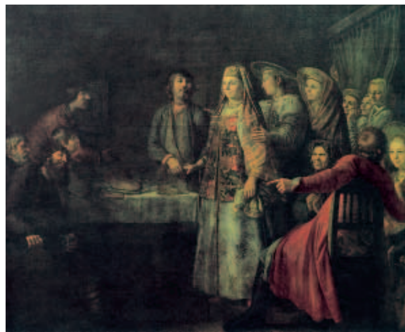
«Праздество свадебного договора». С картины М. Шибанова. 1777 год.

Cain was wealthy enough, yet he often went on a “job” like a lover of extreme sports, who gets a kick out of danger and is bored without risk. He disguised himself as a guards officer, for example, and presented himself at a convent in order to obtain,