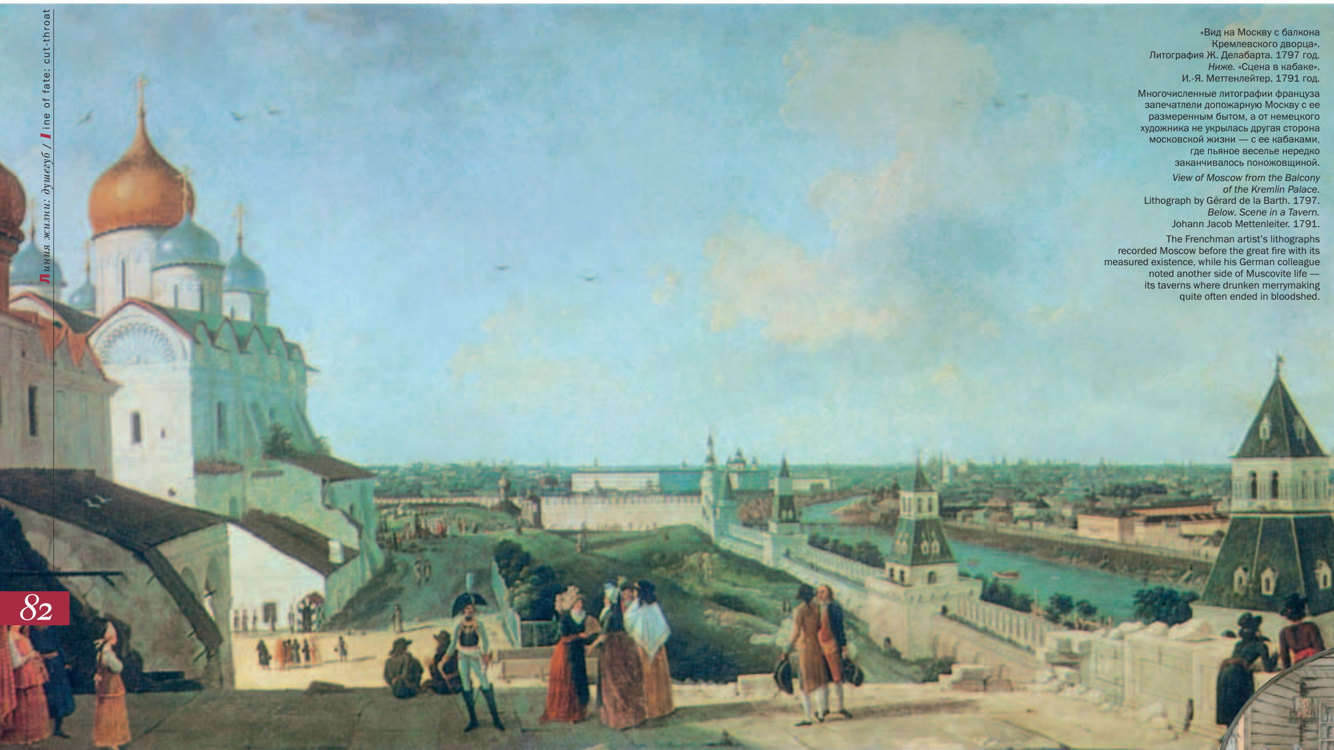
«Вид на Москву с балкона Кремлевского дворца». Литография Ж. Делабарта. 1797 год. Ниже. «Сцена в кабаке». И.-Я. Меттенлейтер. 1791 год.

Многочисленные литографии француза запечатлели дожарную Москву с ее размеренным бытом, а от немецкого художника не укрылась другая сторона московской жизни — с ее кабаками, где пьяное веселье нередко заканчивалось поножовщиной. View of Moscow from the Balcony of the Kremlin Palace. Lithograph by Gérard de la Barth. 1797. Below. Scene in a Tavern. Johann Jacob Mettenleiter. 1791. The Frenchman artist's lithographs recorded Moscow before the great fire with its measured existence, while his German colleague noted another side of Muscovite life — its taverns where drunken merrymaking quite often ended in bloodshed.