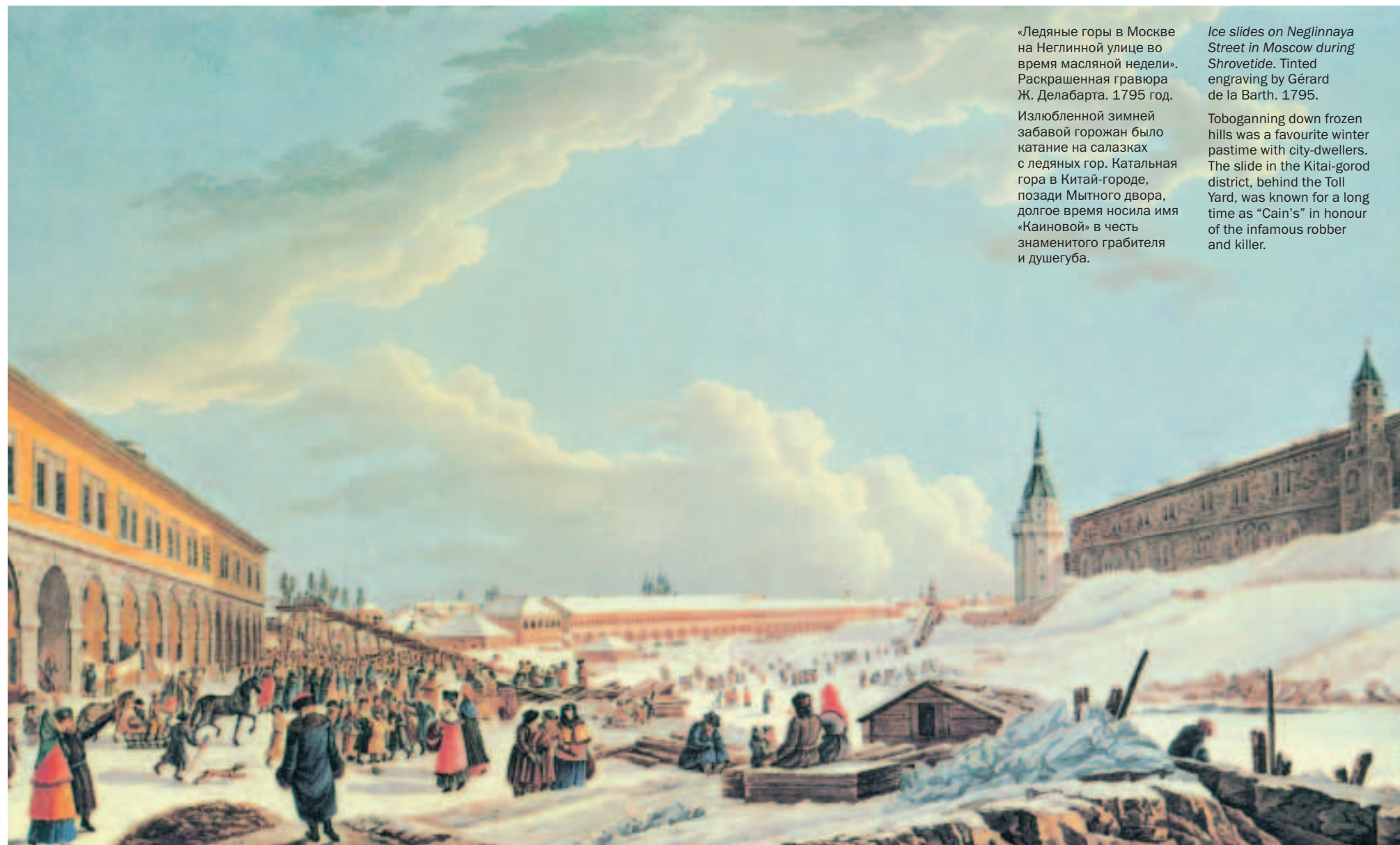
«Ледяные горы в Москве на Неглинной улице во время масляной недели». Раскрашенная гравюра Ж. Делабарта. 1795 год. Излюбленной зимней забавой горожан было катание на салазках с ледяных гор. Каталная гора в Китай-городе, позади Мытного двора, долгое время носила имя «Каиновой» в честь знаменитого грабителя и душегуба.

Разбойные логовища в оврагах, развалинах, среди трущоб особенно населены были зимой, когда «братва» возвращалась с летней «работы» на больших дорогах и реках. Добытчиков встречали скуп-