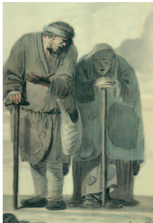
«Нищий и нищая». Начало 1790-х годов.

Особое почтение, которым испокон веков на Руси пользовались «калики перехожие», приводило к постоянному росту профессиональных нищих.