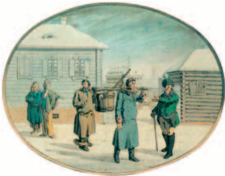
«Ах, матки мои, вор пришел ко мне во двор...». Русский народный лубок. Раскрашенная гравюра на меди. XVIII век.

Prisoners. Etching by Christian Gottfried Heinrich Geissler. 1805. Right up to the early nineteenth century, as well as iron shackles, heavy wooden blocks were sometimes fastened around the neck, arms or legs of convicted criminals in Russia.