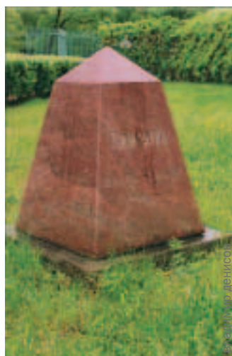
В Собственном садике Гатчинского дворца захоронены 11 животных российских императоров, среди них — верный товарищ Александра III — лайка Камчатка.

History has also recorded the names of many presidential pets. François Mitterand's black labrador has even been extolled in song by the composer Renaud Séchan. Baltique accompanied the French President on all his foreign trips. During his master's visit to Moscow he even stayed in his own room at the Hotel Metropole . And yet when Mitterand died the dog, who was frantic with grief, was not allowed to attend the funeral in church. Even more tragic is the story of the labrador Corbu,