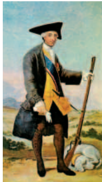
В отличие от других придворных живописцев Франсиско Гойя изобразил Карла III не с атрибутами королевского величия, а в охотничьем костюме и с верным псом. 1780 год.