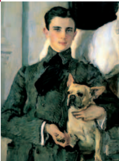
Баснословно дорогих щенков французского бульдога в начале XX века могли приобрести только самые богатые люди. Портрет Феликса Сумарокова-Эльстона, князя Юсупова, работы Валентина Серова. 1903 год.

Only the very wealthy could afford fabulously expensive French bulldog puppies in the early 20th century. Portrait of Felix Sumarokov-Elston, Prince Yusupov, by Valentin Serov. 1903.