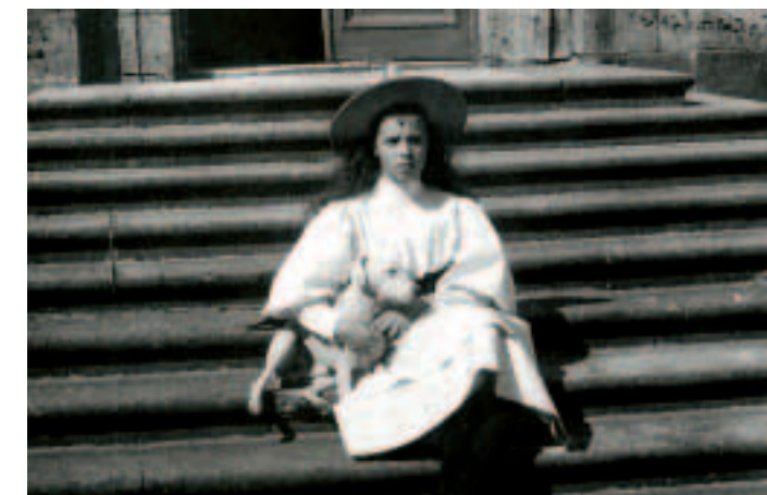
Младшая дочь Александра III великая княгиня Ольга Александровна не расставалась с любимцем и на отдыхе в Абас-Тумане. 1896 год.

Left to right: Alexandra Fiodorovna, King Christian IX of Denmark, his daughter — Empress Maria Fiodorovna, Nicholas II and Grand Duchess Olga Alexandrovna. Peterhof. 1896.