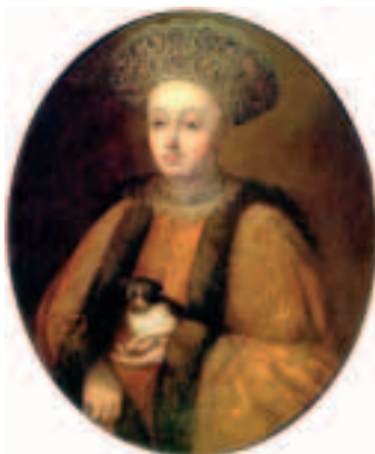
На предсвадебном портрете Марфа Апраксина, будущая жена царя Федора Алексеевича, держит в руках символ супружеской верности — собачонку. Вторая половина XVII века.

In contrast to other court painters Francisco Goya depicted Charles III of Spain not with attributes of his royal dignity, but in a hunting costume with a faithful hound. 1780.