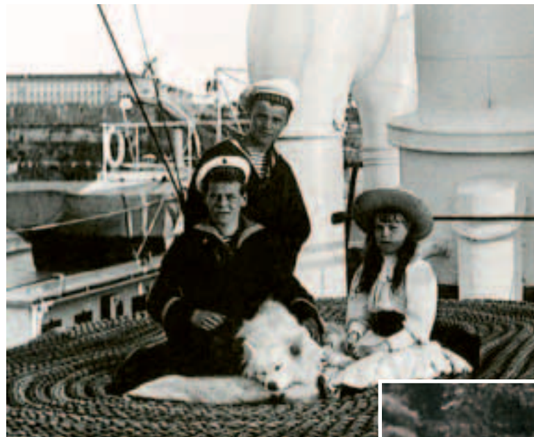
Собачки с детства окружали Романовых. Великий князь Михаил Александрович и великая княгиня Ольга Александровна на берегу Финского залива. 1890-е годы.