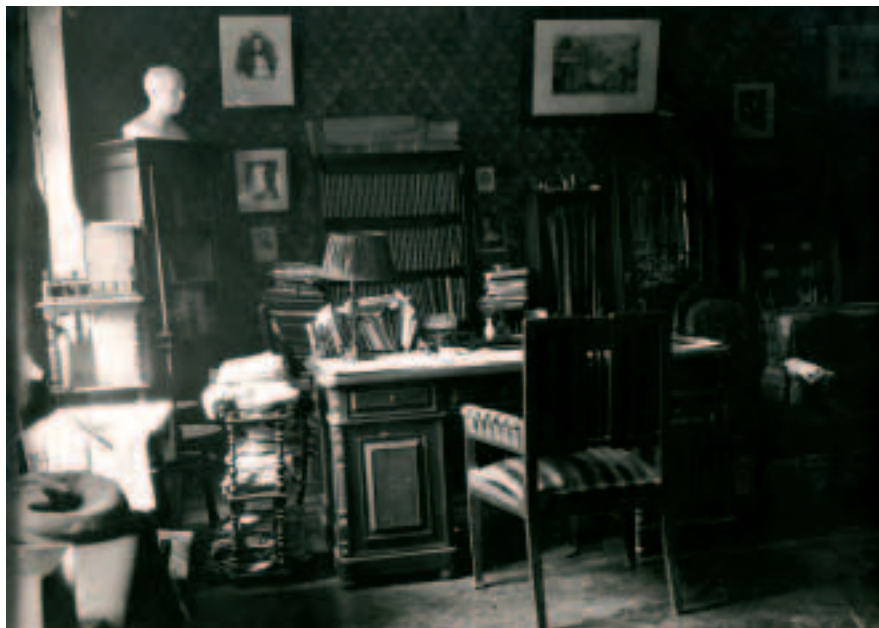
Кабинет Валерия Брюсова в квартире, где завершилась бурная жизнь «вождя русского символизма», ставшего советским чиновником.