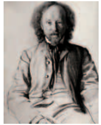
Вячеслав Иванов. С рисунка Константина Сомова. 1906 год.

Мемуаристы непременно рассказывают о его по-наполеоновски скрещенных на груди руках, черном сюртуке, застегнутом на все пуговицы и плотно стягивающем его худую фигуру. Одним он напоминал манекен, другим — хищного зверя: рысь, пантеру или волка, а Максимилиану Волошину — и вовсе «мумифицированную египетскую кошку». Смеяться он не умел — не умел чисто физически, даже в детстве. «Улыбка не красила, а искажала его лицо, — вспоминал гимназический товарищ Валерия, — а когда его заражала