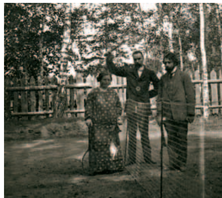
«При сумасшедше честолюбивой жажде женского успеха, при утонченной погоне за женщинами... любил он, по-человечески, сколько мог, одну вот эту незаметную женщину — свою жену», — утверждала Зинаида Гиппиус.

Valery Briusov became head of the All-Russian Union of Poets. At the meeting to mark the fifth anniversary of the union he said: “The writing of verse is one of the manufacturing industries, essentially the same as car-making, factories, ceramics and so on.”