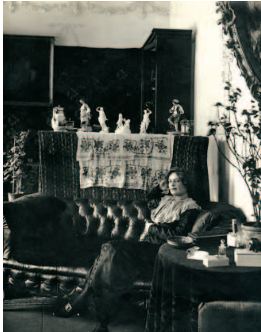
Зинаида Гиппиус в 1918 году записала в своем дневнике: «Не сомневаюсь, что, просиди большевики год (?!), почти вся наша хлипкая, особенно литературная, интеллигенция так или иначе поползет к ним». Брюсов сто процентно оправдал ее пророчество.

Штаб бриусовцев расположился на верхнем этаже гостиницы «Метрополь». Круг ближайших соратников Валерия Яковлевича был узок: Константин Бальмонт, Юргис Балтрушайтис, позже — Андрей Белый. Круг противников — необъятен. Однако Брюсов был мастер по части вербовки сторонников. Даже неглупый человек выносил из общения с ним убеждение, что мэтр всех презирает (и поделом!). Всех — кроме того, с кем разговаривает.