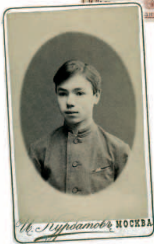
Он начал читать трехлетним, с 11 лет учился в частных гимназиях, поражая товарищей и учителей своей начитанностью и интересом не только к художественной литературе, но и к философским трудам Канта, Лапласа, Дарвина.

He began reading at three. From eleven he studied at private schools, amazing fellow pupils and teachers with his erudition and his interest not only in fiction, but also in the works of Kant, Laplace and Darwin.