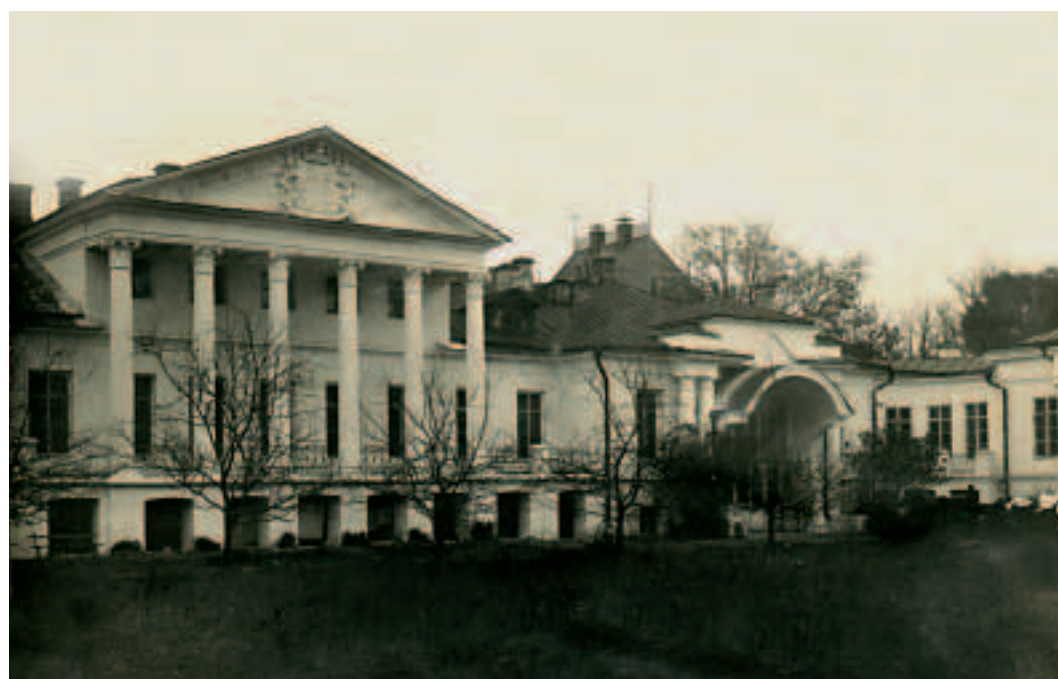
Здание Высшего литературно-художественного института в Москве. Фотография конца 1920-х годов. Здесь Брюсов читал лекции по истории греческой, римской, русской литературы, преподавал теорию стиха, сравнительную грамматику индоевропейских языков, латынь и даже историю математики.