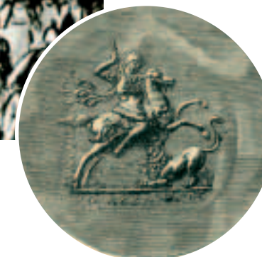
Филипп II многое сделал для Македонии: создал македонскую фалангу и сильный флот, ввел единую монетную систему. Гравюра Шарля-Поля Ландона. 1800-е годы. Слева. Монеты с изображением Александра Великого.