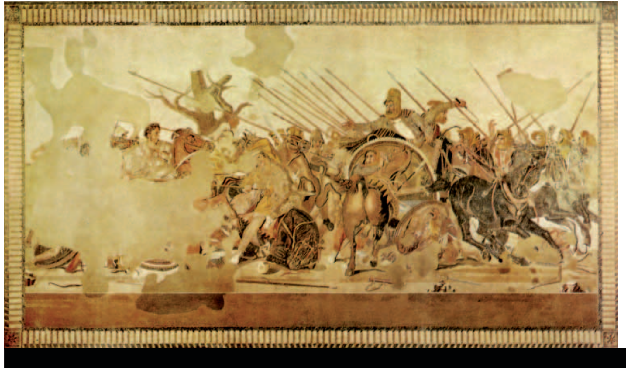
Битва Александра с Дарием. Мозаика из Дома фавна в Помпеях.

«Чтобы образно охарактеризовать жизненный путь и власть Александра, можно сказать, что он завладел всей землей, которую он видел, и умер, помышляя и мечтая об остальной».