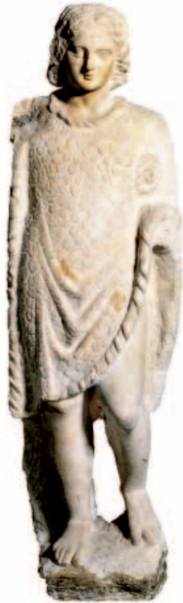
Александр в эгиде. Мрамор. Скульптура эпохи эллинизма.

Александр видел, что его приближенные изнежились вконец, что их роскошь превысила всякую меру. За все это царь мягко и разумно упрекал своих прибли-