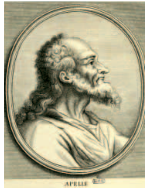
Художник Аппеллес, величайший греческий живописец при дворе Александра Великого, славился грацией своих Венер и Диан, благородством изображений самого полководца. Увы, его работы до наших дней не сохранились.

женных. Александр высказывал удивление, как это они, побывавшие в стольких жестоких боях, не помнят о том, что потрудившиеся и победившие спят слаще побежденных. Разве не видят они, сравнивая свой образ жизни с образом жизни персов, что нет ничего более рабского, чем роскошь и нега, и ничего более царственного, чем труд? Александр намеревался отправиться в Индию, но, видя, что из-за огромной добычи войско отяжелело и стало малоподвижным, однажды на рассвете велел нагрузить повозки, и сначала сжег те из них, которые принадлежали ему самому и его друзьям, а потом приказал поджечь повозки остальных македонян. Оказалось, что отважиться на это дело было гораздо труднее, чем совершить его. Лишь немногие были огорчены, большинство же, раздав необходимое нуждающимся, в каком-то порыве восторга с криком и шумом принялось сжигать и уничтожать все излишнее. Это еще более воодушевило Александра и придало ему твердости.