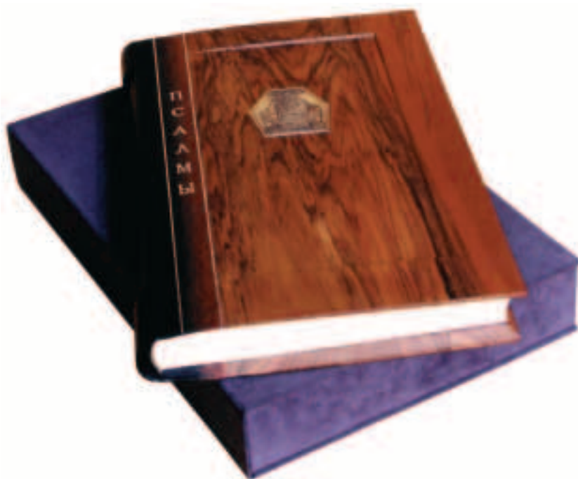
«Псалмы Давида» в ореховом переплете с серебряной пластиной, гравированной Павлом Татарниковым.

«Тонко подмечено, — улыбается Петр. — Конечно, за десятки лет наши эстетические вкусы и ценности были настолько нивелированы, что трудно даже представить, что может вновь возникнуть круг ценителей-библиофилов или любителей рукотворных книг. Но я ни о чем таком не задумывался, а просто следовал своему призванию, как ни высокопарно это звучит. И очень рад, что обрел дело, в котором соединились и мои организаторские способности, и художественные пристрастия».