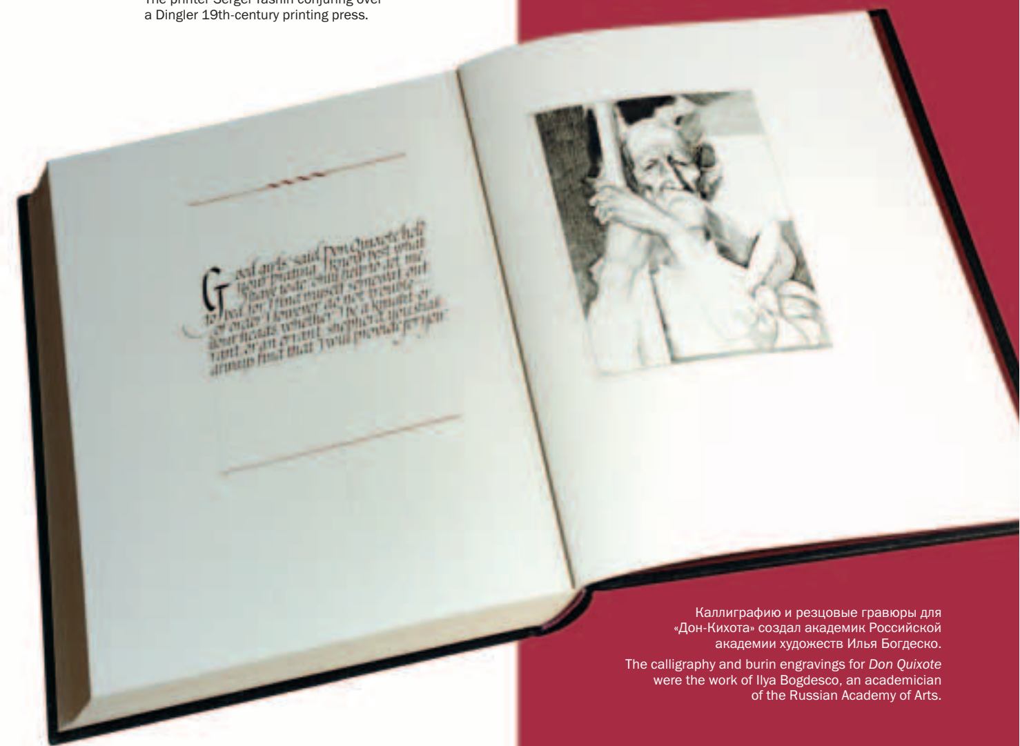
Каллиграфию и резцовые гравюры для «Дон-Кихота» создал академик Российской академии художеств Илья Богдеско. The calligraphy and burin engravings for Don Quixote were the work of Ilya Bogdesco, an academicien of the Russian Academy of Arts.