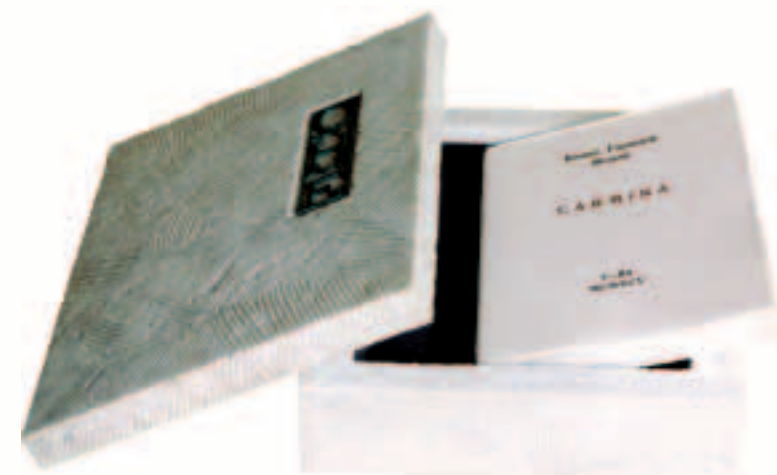
«Оды» Горация в шкатулке из каррарского мрамора с бронзовой накладкой. Horace's Odes in a Carrara marble casket mounted with bronze.