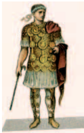
Римский центурион. Будучи в Италии, Ганнибал увидел, что римское вооружение значительно лучше африканского, и вооружил им карфагенскую армию. Ниже. Метательное орудие римлян.