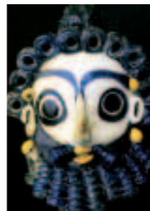
Финикийский амулет. Стекло. IV—III век до н. э. Карфаген был основан в 825 году до н. э. финикийцами и пять веков был центром могущественной державы Средиземноморья, соперничавшей с Римом.

Справа. На рисунке Никола Пуссена изображен боевой слон. 1630 год.