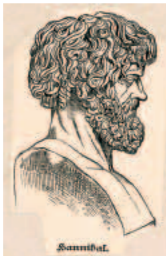
Ганнибал. Гравюра неизвестного художника. XIX век.

Во время Второй пунической войны в римской армии появились наемные солдаты, которые получали от государства не только одежду и оружие, но и жалованье. А в армии Ганнибала большую часть составляли иноплеменики.